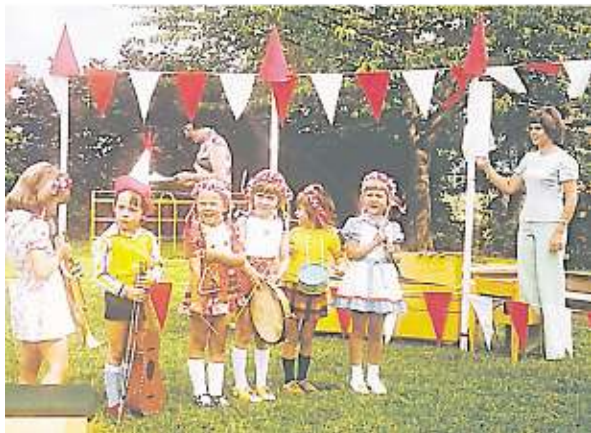
Vor dem großen Auftritt: Junge Musikanten in Rheurdt 1975.