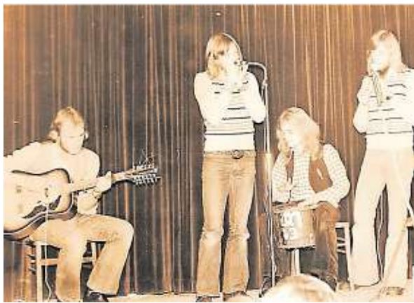
Die Gruppe „Et loeppt“ aus Aldekerk, gegründet 1974. Aus ihr ging 1982 die Band „Moyland“ hervor.

Züchtige Schlussballteilnehmer, ausgelassene Jecken, lokale Musikgrößen wie die „Drakes of Dixieland“, englische RAF-Piloten, ein Auto namens Ford Consul, Zirkus Althoff auf dem ehemaligen Kasernengelände in Geldern: Das Buch ist ein wunderbares Kaleidoskop eines Jahrzehnts, das im nostalgischen Rückblick vieler mit dem Adjektiv „wild“ belegt wird. Auch wenn es mit dem Rebellentum bei den allermeisten doch gar nicht weit her war.