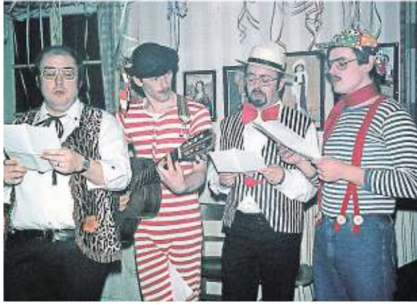
Liedvortrag bei der Karnevalsfeier des Kirchenchors Aldekerk 1978.