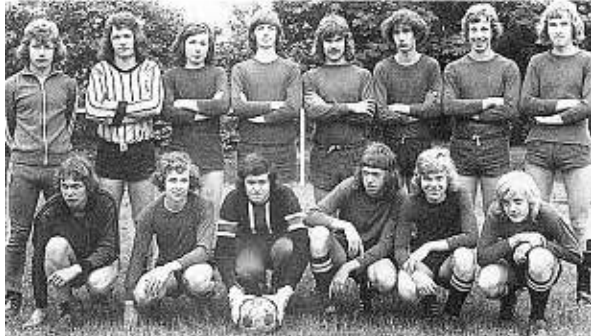
Gut gespielt: Die A-Jugend des SV Veert wird 1974 Stadtmeister.