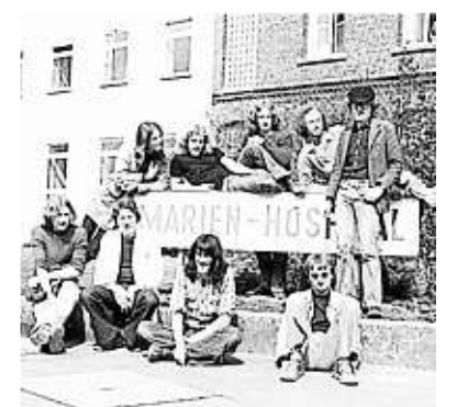
Wie eine Rockband: Zivildienstleistende am Marienhospital Kevelaer, 1978.

Verkaufsstellen Das Buch gibt es in der Geschäftsstelle des Historischen Vereins an der Hartstraße, in den Buchhandlungen Keuck und Bücherkoffer in Geldern sowie beim Gemeindearchiv Kerken.