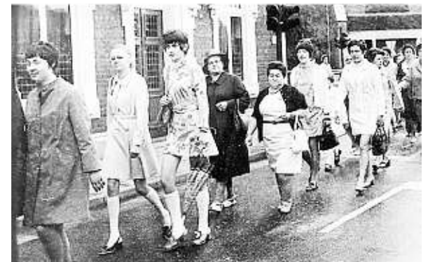
Pilgerinnen aus Kervenheim in Kevelaer, 1970. Die Männer gingen getrennt.